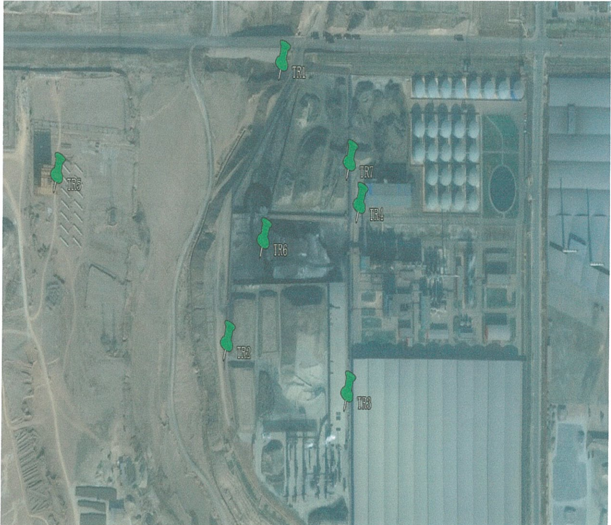
图 3-1 土壤检测点位示意图